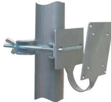
Fissaggio a palo