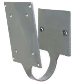
Fissaggio a muro